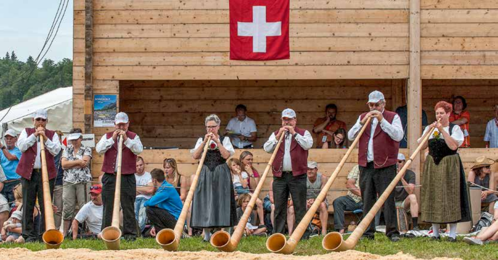
Gewöhnlich über 4000 Schwingerfreunde geniessen das Volksfest auf dem Weissenstein.

Schwinget) gedeckt. Der Rest resultiert aus Zuschauereinnahmen (Eintritte und Festwirtschaft).