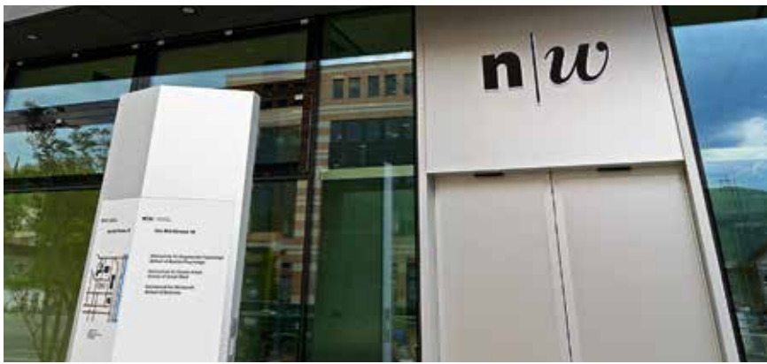
Die Zusammenarbeit zwischen Expertenorganisationen wie Fachhochschulen und KMU ist eine Stärke der Schweiz.

So weit, so gut. Wenn man genauer hinschaut, gibt es aber durchaus noch Optimierungsmöglichkeiten. Ich kenne die Fachhochschulwelt genau. Deshalb gestatte ich mir dazu einige Bemerkungen. Unsere Studierenden arbeiten während ihres Studiums an Praxisprojekten. Konkret: Firmen und Institutionen reichen Projekte und Fragestellungen ein. Studierende arbeiten unter der fachlichen Betreuung eines Dozenten an der Problemlösung und präsentieren dem Auftraggeber dann die Resultate. Dafür bezahlt das Unternehmen maximal 2000 Franken und erhält praxistaugliche Lösungen. Die Studierenden lernen am konkreten Praxisprojekt. Die Fachhochschule leistet einen Beitrag zur Weiterentwicklung der künftigen Fach- und Führungskräfte und zur Stärkung der Unternehmen. Wir haben also einen dreifachen Gewinn davon.