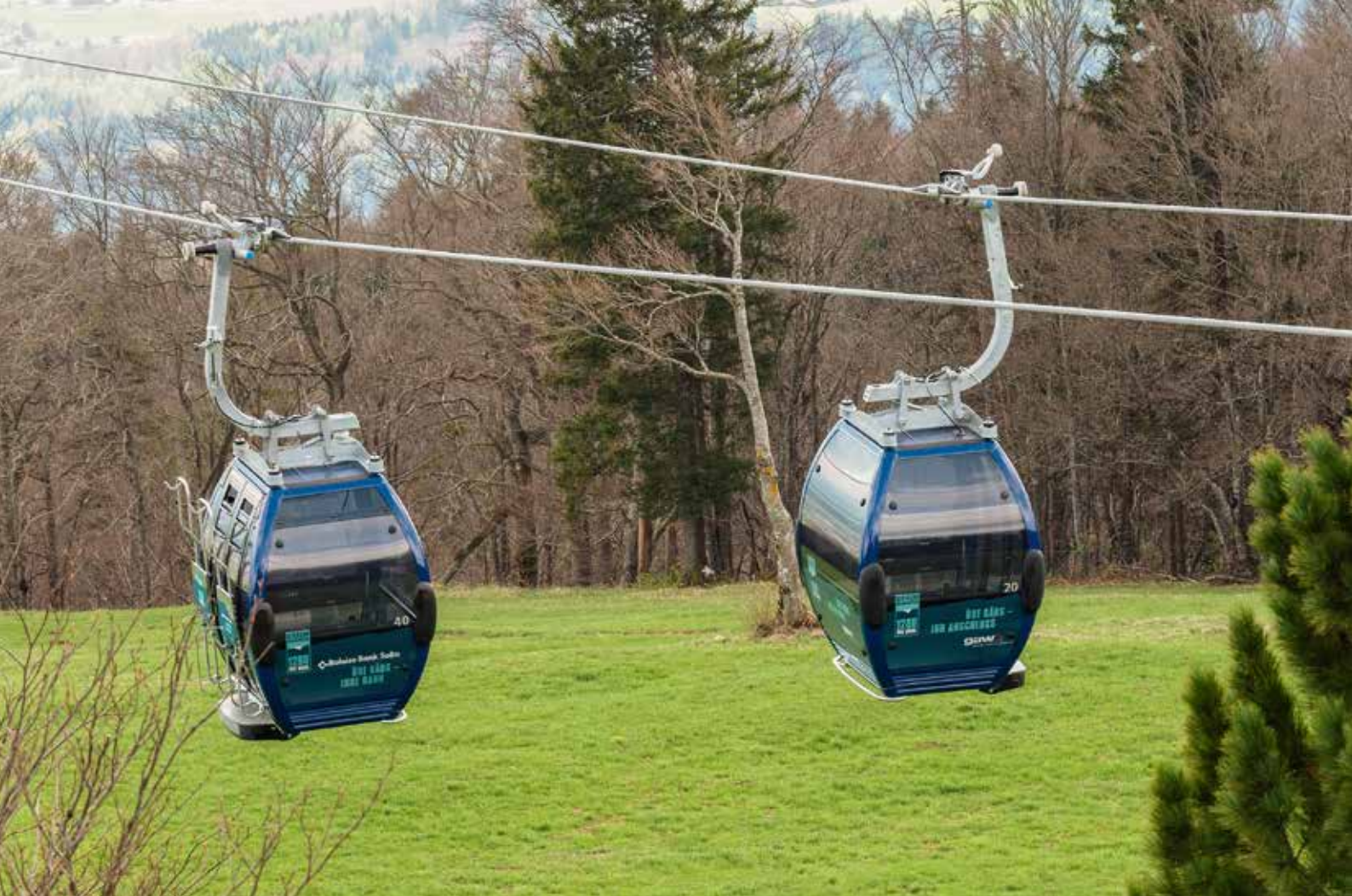
Die Seilbahn von CWA auf den Weissenstein: Schweizer Qualität aus dem Kanton Solothurn auch für den Solothurner Hausberg.