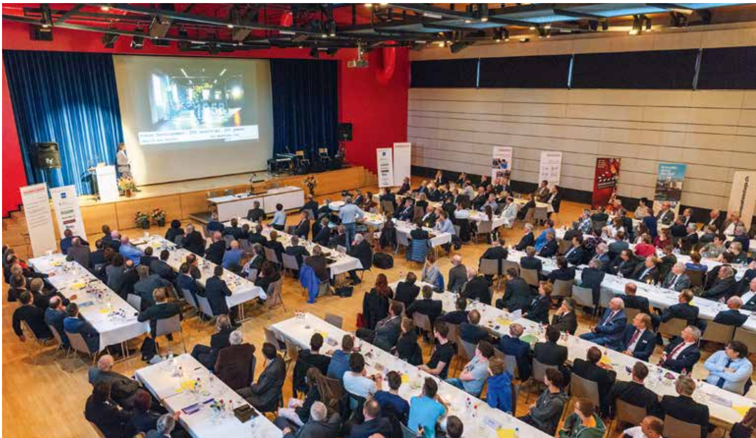
Positive Grundstimmung, wertvolle Informationen, kollegialer Gedankenaustausch, ansprechendes Rahmenprogramm – keiner der Gäste bereut, an der Generalversammlung der Solothurner Handelskammer teilgenommen zu haben.