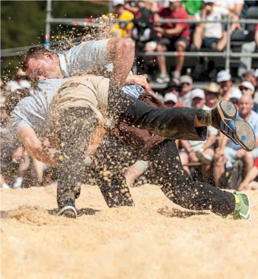
Der Weissenstein-Schwinget ist seit 2000 ein Kranzfest. Dieses zu gewinnen, ist auch für die erfolgreichsten Schwinger des Landes ein Ziel.