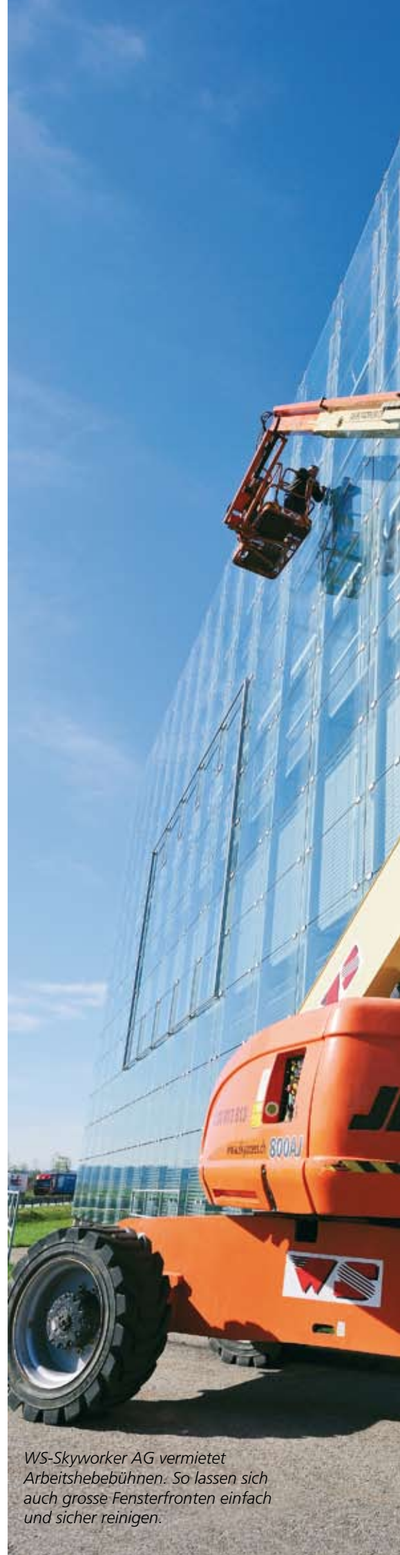
WS-Skyworker AG vermietet Arbeitshebebühnen. So lassen sich auch grosse Fensterfronten einfach und sicher reinigen.