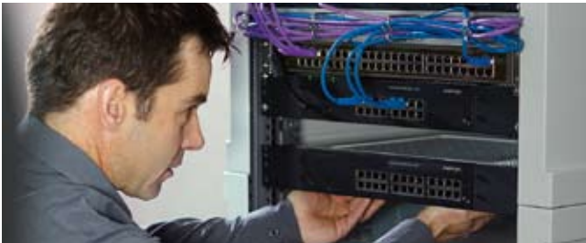
Neuer Aastra-Server: Ein multifunktionales Talent auch für KMU.

«All in one» nun auch für KMU! Aastra Telecom Schweiz AG, führender Hersteller von Systemen für die Unternehmenskommunikation mit Hauptsitz in Solothurn, hat den brandneuen Aastra 400-Kommunikationsserver auf den Markt gebracht.