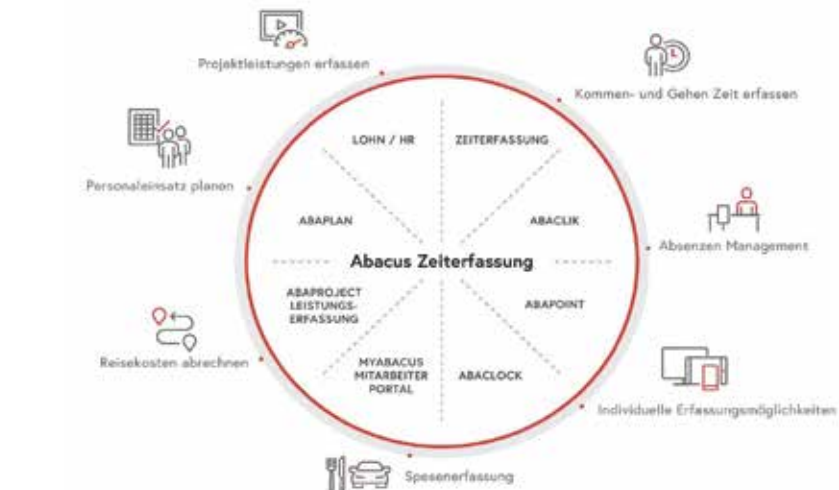
Das Zeiterfassungssystem von Abacus überzeugt durch einen umfassenden Leistungskatalog inklusive Personaleinsatzplanung, Spesenabrechnung und Veraltung von Absenzen.

Mit einem ausgereiften System können Unternehmen aus der Pflicht zur Arbeitszeiterfassung einige Vorteile gewinnen. So registrieren zeitgemässe Lösungen heute nicht nur das «Kommen und Gehen». Ist eine Zeiterfassung in ein ERP-System integriert, lassen sich daraus zusätzliche Vorteile erzielen. So werden beispielsweise mit der Zeiterfassungslösung von Abacus nicht nur Ein- und Ausgangszeiten registriert, sondern es lassen sich auch Personaleinsätze planen, Leistungen erfassen sowie Spesen und Reisekosten abrechnen. Auch können damit Absenzen verwaltet werden. Gleit- und Überzeiten sowie Feriensaldi sind jederzeit für die Mitarbeitenden in