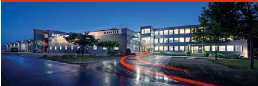
Das Familienunternehmen versteht sich als Vorreiter: Bereits 1985 wurde in der Härterei Gerster AG in Egerkingen eine erste Wärmepumpe installiert.