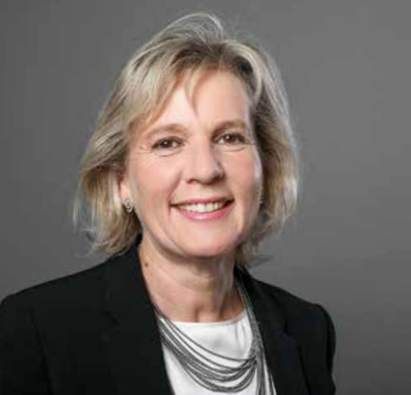
Regierungsrätin Brigitt Wyss, Vorsteherin des Volkswirtschafts- departements des Kantons Solothurn

Was sie uns für 2020 mit auf den Weg geben möchten: Fünf Persönlichkeiten aus der Politik, der Wirtschaft und dem Gewerbe des Kantons Solothurn und ihre Gedanken zum neuen Jahr.