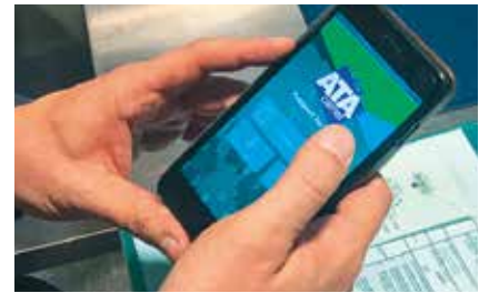
Das Carnet ATA in elektronischer Form: Formalitäten sollen künftig anhand einer Smartphone-App abgewickelt werden können.

Wie in den Anfängen des Carnet ATA spielt die Schweiz auch bei der Digitalisierung erneut eine zentrale Rolle. Die Vereinigung der Schweizer Handelskammern ist Mitglied einer internationalen