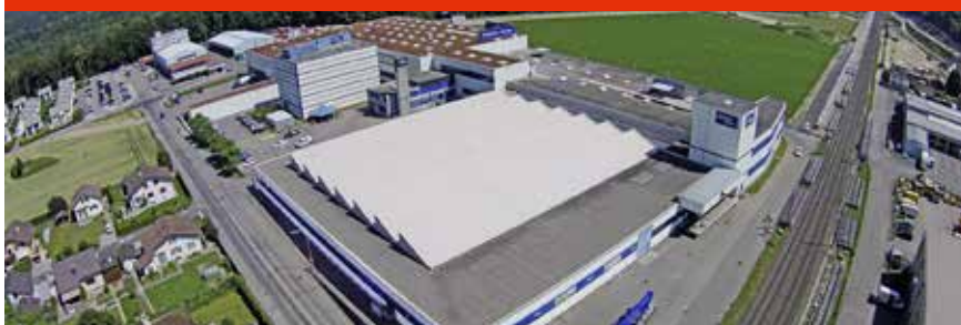
Die Schenker Storen AG wurde 2007 als eines der ersten Unternehmen in der Branche nach der Umweltnorm ISO 14001 zertifiziert.