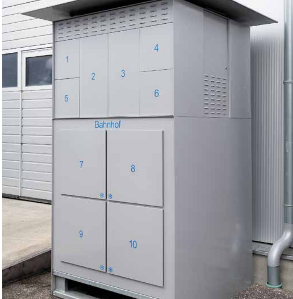
«Intelligenter Briefkasten». Mit ihrer «s: yourbox» schafft die Gewinnerin des InnoPrix SoBa 2019 die Möglichkeit, Waren von unterschiedlichster Grösse sicher zu deponieren. Der Zugriff zu den Fächern erfolgt entweder über eine App oder mit Codes, die per SMS oder E-Mail versandt und via Touchscreen oder Zahlentastatur zur Boxöffnung berechtigen und nach einmaligem Gebrauch verfallen.