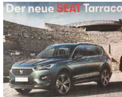
Auf Stadtberner Boden sollen unter anderem Plakate mit Autowerbung verboten werden.

und Autos verschwinden. Sonstige Werbung zum Beispiel für Urlaub in fernen Ländern sei zudem mit einem Warnhinweis zu versehen, wonach Fliegen der Umwelt und damit auch der Gesundheit dieser und künftiger Generationen schweren Schaden zufüge. Die mehrheitlich rot-grün besetzte Exekutive der Stadt Bern unterstützt das Ansinnen der «Jungen Alternativen». Noch als Nationalrätin forderte die grüne Genfer Neo-Ständerätin Lisa Mazzone am 6. März 2019 mittels einer Motion den Bundesrat auf, «ein Gesetz zu erlassen, durch das sämtliche in Verbindung mit dem Flugverkehr stehende Werbung zwingend durch grossformatige Hinweise für Konsumentinnen und Konsumenten zu den umweltschädlichen Auswirkungen von Flugreisen gekennzeichnet wird.» Dabei könne sich die Landesregierung an den Warnhinweisen auf den