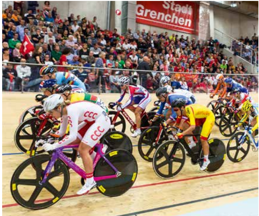
Mit vier Medaillen übertrafen die Schweizer Bahnfahrer an der Heim-EM die Erwartungen. Das Besondere daran: Edelmetall holten sie im Kanton Solothurn – im 2013 eingeweihten Velodrome Suisse in Grenchen.

Daniela Ryf gehört seit Jahren zu den besten Triathletinnen der Welt. Seit 2012 holt die 28-Jährige einen Titel nach dem anderen und ist an internationalen Rennen immer in Spitzenrängen dabei. Die mehrfache Welt- und Europameisterin auf der Mitteldistanz und Europameisterin auf der Ironman-Distanz schaffte am 10. Oktober 2015 den ganz grossen Coup und realisierte, wovon sie vor einem Jahr noch geträumt hatte: Den Weltmeistertitel auf Hawaii! Ryf distanzierte ihre Gegnerinnen über die 3,86 km Schwimmen, 180 km Radfahren und 42,2 km Laufen um