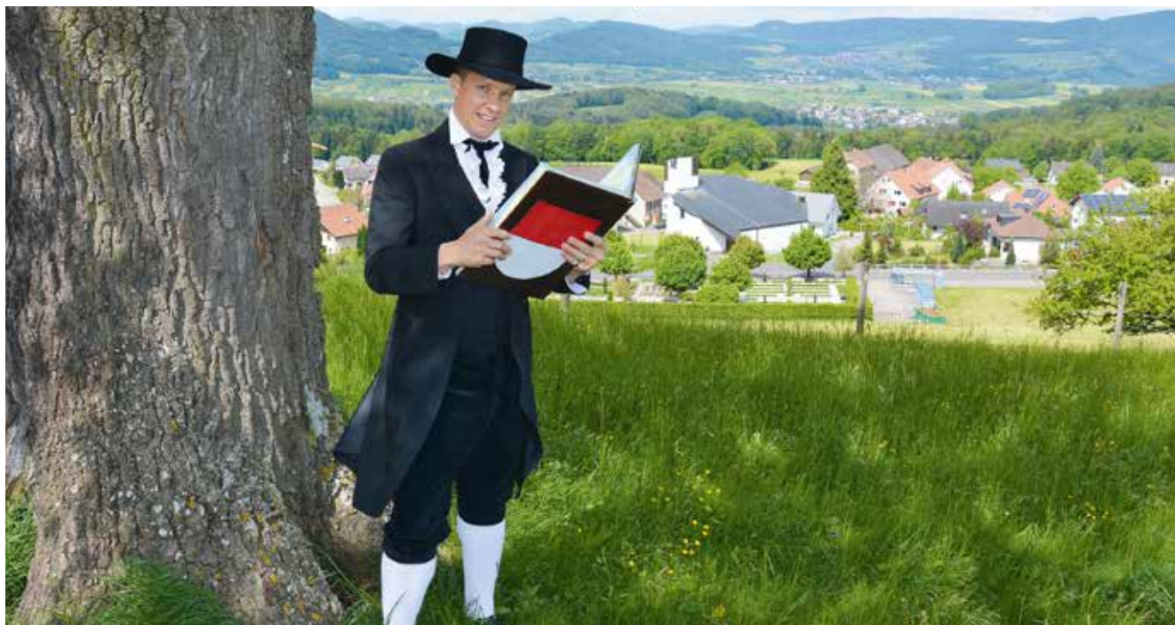
Ein Komet am Himmel? Nein. Der Schwarzbube Christian Imark steht fest auf dem Boden und absolviert politische Höhenflüge. Mit 19 wurde der SVP-Politiker Kantonsrat, mit 29 war er der jüngste Kantonsratspräsident und seit dem 18. Oktober vertritt er den Kanton als Nationalrat.