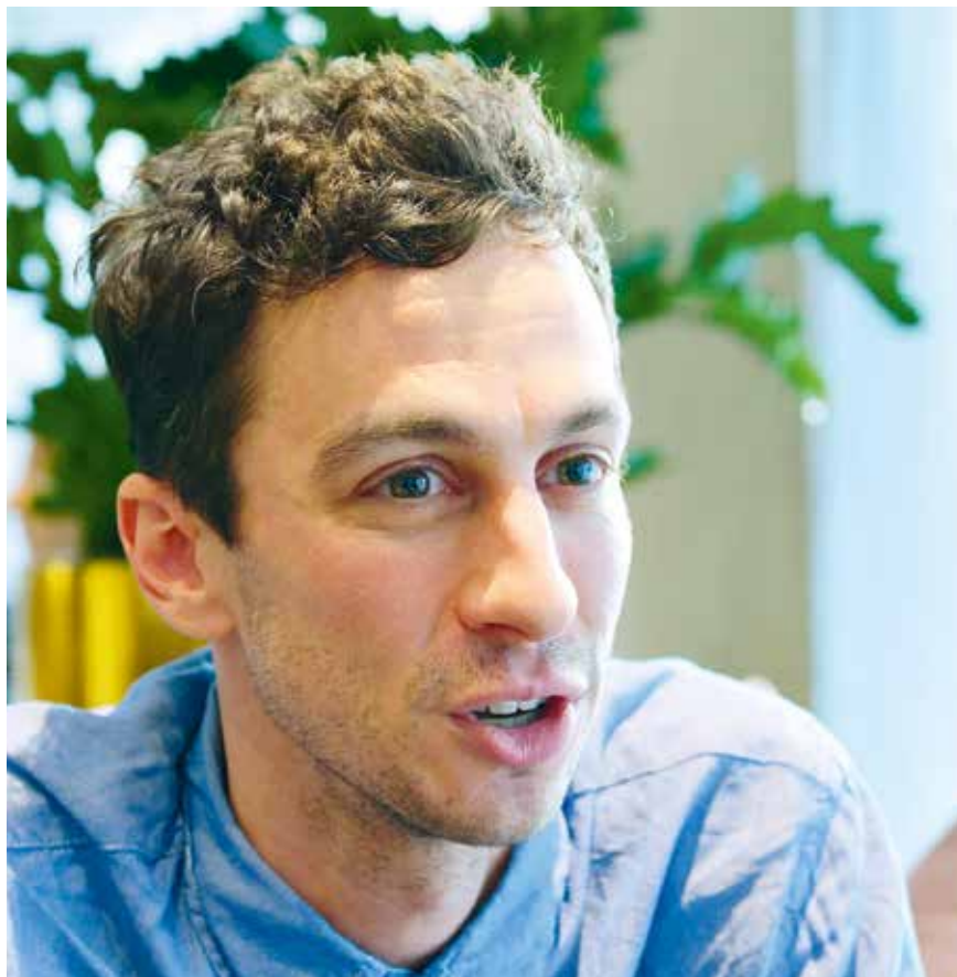
Online versus offline: Hier gilt es, eine stimmige Balance zu finden.