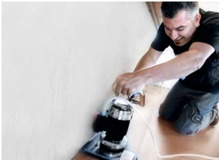
Die Mobilia Solothurn AG ist spezialisiert auf das Verlegen und Renovieren von Bodenbelägen.

Das Verlegen und die Renovation von Bodenbelägen (exklusive Keramik) ist das Kerngeschäft des Solothurner Gewerbetriebs. Das Familienunternehmen übernimmt jeweils auch die gesamte Beratung und Projektabwicklung in Neubauten und Renovationen. Aktuell beschäftigt sich Mobilia mit dem weltweit schnellsten Bodensanierungssystem. Schnell sanieren und Zeit sparen, heisst die Devise. Das sei vor allem in 24-Stunden-Betrieben wie Krankenhäusern, Altersheimen, Flughäfen oder Shopping-Zentren ganz wichtig. «Da ist eine zeitintensive Bodensanierung fast nicht möglich. Es wäre ein erheblicher