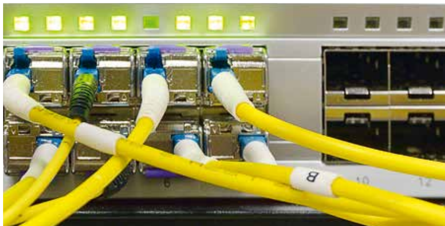
Die GA Weissenstein GmbH versorgt seit 2001 30 Vertragsgemeinden mit einem TV-Senderangebot.

Die Umstellung auf FttH-Infrastruktur wird inklusive Glasfasersteckdose (OTO) durch die GAW finanziert. Kundenseitig sind dabei die Kabelwege in der Infrastruktur zur Verfügung zu stellen. Sind diese vorhanden, entstehen dem Kunden keine Kosten. Ab dieser Glasfaser-Steckdose ist die weitere Verkabelung innerhalb der Liegenschaft Sache des Kunden. Dies ist nichts Neues und war bereits in der Vergangenheit so. Unsere Erneuerungen in der Technologie finden in der Liegenschaft ihre Fortsetzung. Anpassungen in der Liegenschaft können somit nicht restlos vermieden werden. Tendenziell kann davon ausgegangen werden, dass das kundenseitige Engagement sich mit dem Alter der Liegenschaft erhöht. Demgegenüber erhält der Kunde jedoch einen Mehrwert, welcher sich in