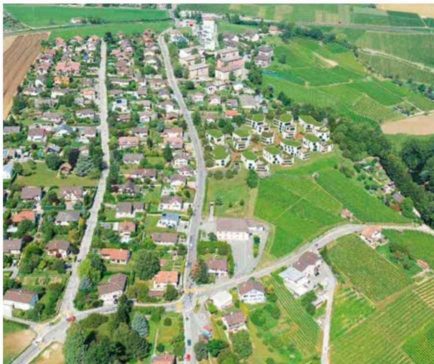
An den Grenchner Wohntagen 2015 war auch die Überbauung Vitis in Boudry (NE) als Beispiel für eine optimale Einbettung von Neubauten in die Natur ein Thema.

auch einen Forschungsauftrag. Um Resultate und erarbeitetes Know-how unter die Leute zu bringen, wurden die Grenchner Wohntage ins Leben gerufen. Seither gibt es alle Jahre eine Fachtagung und weitere Anlässe für ein breites Publikum. Für die doch eher trockene Arbeit des Statistikers ein richtig guter Auftrag.