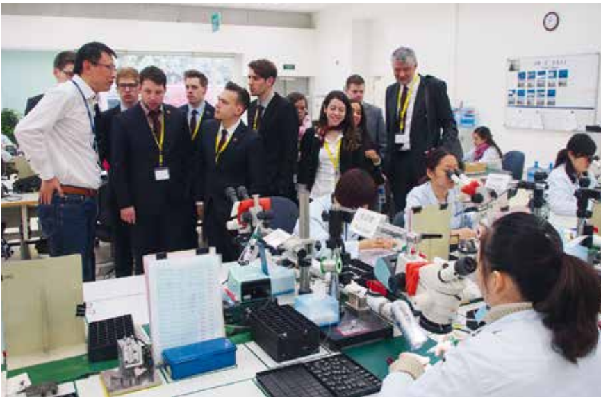
Insight China 2015: Studierende erhalten einen Einblick in die Unitron Factory der Sonova Group in Suzhou.

Nach Insight China, Focus India und connectUS wurde dieses Sommer exploreASEAN neu lanciert. Dabei liegt die wachsende Bedeutung der ASEAN Gemeinschaft im Fokus. Den Studierenden soll die Diversität der einzelnen Mitgliedstaaten näher gebracht werden.