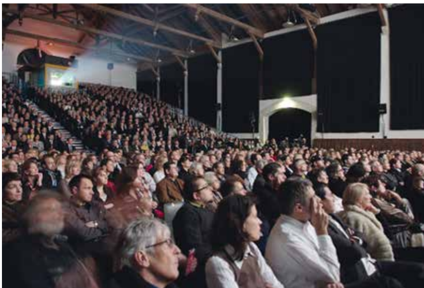
Die Solothurner Filmtage sind 2015 50 Jahre alt geworden. Sie zählen den zu den renommierten Kulturveranstaltungen der Schweiz.