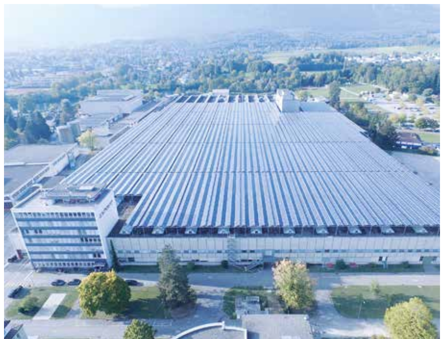
Die Photovoltaik-Anlage auf dem Areal «Riverside» in Zuchwil entspricht dem Stromverbrauch von 2700 Personen oder 1027 Einfamilienhäusern.

Mit durchschnittlich 75 000 Flugbewegungen pro Jahr ist der Airport Grenchen der Schweizer Regionalflughafen mit der grössten Bewegungszahl. Grenchen hätte sich mit einer Pistenverlängerung von 450 Metern in der Grenchner Witi-Schutzzone als Flughafen-Standort weiter entwickeln können. Wirtschaft, Region und die Bevölkerung hätten davon gleichzeitig profitieren können. Sieben Jahre lang hatte die Flughafenleitung geplant und ihr Projekt auch auf Wunsch der Regierung mehrmals angepasst. Zuerst sollte die Piste nach Osten gehen, dann nach Westen und schliesslich, seit dem Mai 2014 wieder nach Osten. Alle Zeichen deuteten darauf hin, dass die Solothurner Regierung ihren Segen für eine Weiterbearbeitung geben würde. Kurz vor dem Entscheid des Fünfer-Gremiums versammelten sich 300 Demonstranten vor dem Rathaus und weibelten gegen den Ausbau der Piste. Auf der negativen Beurteilung eines Chefbeamten basierend, setzte die Regierung wenige Tage später zum Blindflug an und empfahl den Verantwortlichen, die Übung abzubrechen.