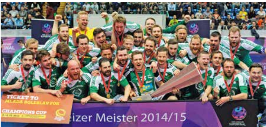
Sie spielen im Sportzentrum Zuchwil gross auf und heissen SV Wiler-Ersigen. Ende der Neunzigerjahre begann die Erfolgsgeschichte mit zehn Schweizer Meistertitel in zwölf Jahren.

Während einer Woche standen Grenchen und sein Velodrome Suisse im internationalen Scheinwerferlicht. Im Juni 2013 wurde die Bahn eröffnet und ihrer vielfältigen Bestimmung übergeben. Gut zwei Jahre später stellten sich die Verantwortlichen mit der Bahn-EM einer ersten grossen Bewährungsprobe. Die Erwartungen wurden sowohl in logistischer wie auch sportlicher Hinsicht erfüllt. Mit vier Medaillen übertrafen die Schweizer Bahnfahrer an der Heim-EM die Erwartungen. Das Velodrome erwies sich als EM-tauglich und erhielt am zweitletzten Renntag mit dem 500-Meter-Weltrekord der Russin Anastassija Woinowa das Gütesiegel einer schnellen Bahn. Die vorsichtig budgetierten Zuschauerzahlen wurden weit übertroffen, die Halle mit ihren 1500 Sitzplätzen war zweimal ausverkauft, die Stimmung grossartig. Rund gelaufen, kann man da nur sagen.