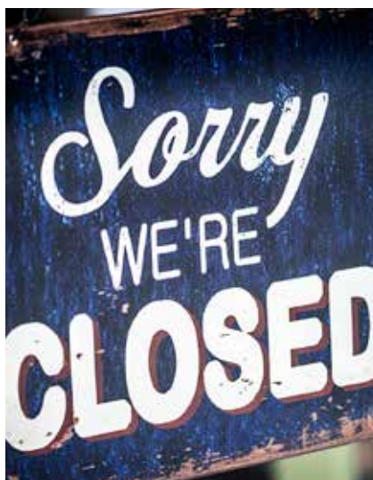
Das Solothurner Stimmvolk hat entschieden: Es gibt keine Liberalisierung der Ladenöffnungszeiten.

Die Linke hatte im März mit einem klaren Nein zu weniger Prämienverbilligungen und einem unmissverständlichen Ja zu den aktuellen Ladenöffnungszeiten einen guten Abstimmungs-Sonntag im Kanton Solothurn. Das Solothurner Stimmvolk folgte den Empfehlungen der linken Parteien und der CVP. Das Gewerbe wünschte vor allem eine Liberalisierung der Ladenöffnungszeiten.