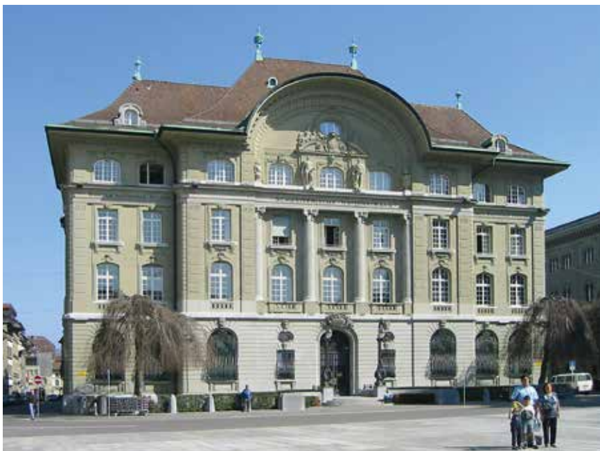
Mit der Aufhebung des Euro-Mindestkurses hat die Schweizerische Nationalbank auch der exportorientierten Solothurner Wirtschaft ein schweres Erbe aufgelegt.