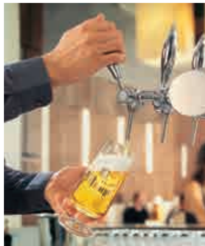
In der Schweiz wird immer mehr Bier getrunken, das in Deutschland gebraut worden ist.

sagt – die Einwohner der drei Gemeinden und der angrenzenden Gebiete mit den kleinen und mittleren Unternehmen zu vernetzen. Gleichzeitig soll aber die GALOR auch ein Fest werden, heisst es in einer Pressemitteilung. Nebst zahlreichen Aktivitäten für Jung und Alt versprechen zwei Konzerte ein grossartiges Abendprogramm am verlängerten Wochenende vom 25. bis 28. April 2013. Als Gast begrüsst die Gewerbeausstellung in Langendorf die Region Puschlav.