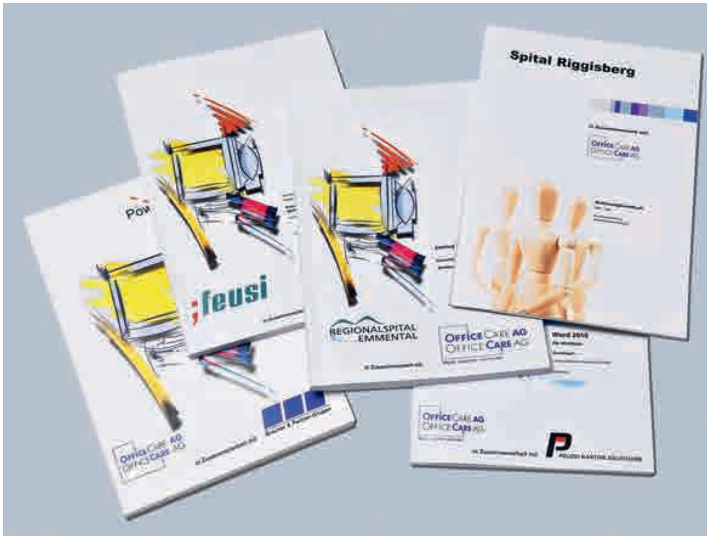
Die OfficeCare AG mit Sitz in Gerlafingen erstellt für individuelle Office Schulungen in einzelnen Unternehmen benutzerfreundliche Manuals.