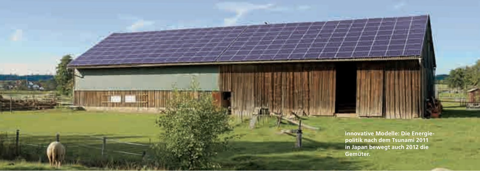
Innovative Modelle: Die Energiepolitik nach dem Tsunami 2011 in Japan bewegt auch 2012 die Gemüter.