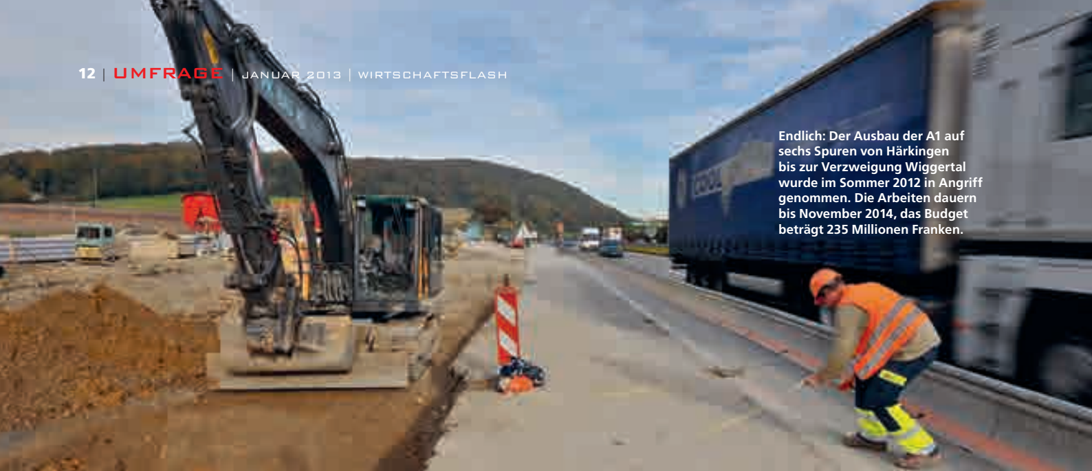
Endlich: Der Ausbau der A1 auf sechs Spuren von Härkingen bis zur Verzweigung Wiggertal wurde im Sommer 2012 in Angriff genommen. Die Arbeiten dauern bis November 2014, das Budget beträgt 235 Millionen Franken.