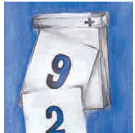
Calendar Input+ ist im App- und Playstore erhältlich.

Nutzen Sie die bereits installierten Office Werkzeuge und optimieren Sie diese. Es gibt Tools, die aus den Werkzeugen (Software) tolle und einfach bedienbare Hilfsmittel gestalten. Man braucht für diese keine wiederkehrende Zusatzlizenzen zu bezahlen. Drei Klicks, schon hat man den fertigen Brief erstellt. Und das unter Einhaltung der unternehmensweiten Corporate Design Guidelines. Als Basis dazu dienen Vorlagen, welche dank Steuerungsmasken in der Anwendung noch einfacher werden, einfacher als die integrierten Standardvorlagen.