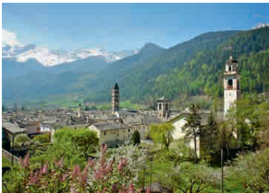
Das Puschlav ist Gast an der Gewerbeausstellung GALOR 2013 in Langendorf.

Einkaufstouristen sind auf den Geschmack gekommen, das wissen wir – zwischenzeitlich auch aufs Bier! Der gesamte Biermarkt Schweiz verzeichnete nämlich im vergangenen Braujahr (Oktober 2011 bis September 2012) einen Zuwachs von 31 236 Hektolitern Bier auf 4 623 631 Hektoliter. Die Zunahme von 0,7 Prozent ist nämlich geprägt durch einen erneuten Anstieg der Bierimporte von 4,1 Prozent. Der Importanteil beträgt nun bereits 23,7 Prozent. Jedes zweite Ausländer-Bier stammt dabei aus Deutschland. Die wachsende Beliebtheit des deutschen Bieres wird vorab mit der Preispolitik der Discounter und der anhaltend hohen Einwanderung aus dem nördlichen Nachbarland erklärt.