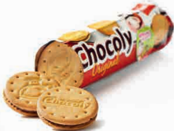
Typisch Wernli: Die Neuauflage der Chocoly-Rollen.

rienne Wüthrich Gross, selber Lebensmittelingenieurin und seit 2008 Geschäftsleiterin am Standort Trimbach. Eine weitere Herausforderung stelle dann die Umsetzung aus der Backstube in die Massenproduktion dar. Betritt man die Produktionshallen, riecht es denn auch fein nach Chrömlli, fast wie daheim in der vorweihnächtlichen Guezli-Zeit. Doch schon bald wird klar, dass Wernli in anderen Dimensionen backt. Mit armlangen Knetstangen und Schüsseln, die eine halbe Tonne fassen, wird der Teig für die jeweilige Produktion angerührt. Für ihre 18 Biscuit-Sorten benötigt Wernli rund 150 verschiedene Zutaten. Die Löwenanteile machen dabei Mehl (1340 Tonnen pro Jahr), Zucker (1000 Tonnen) und Schokolade (1060 Tonnen) aus, gefolgt von 880 Tonnen Butter und Pflanzenfetten, 143 Tonnen Haselnüssen und Mandeln, 55 Tonnen Marmelade sowie 41 Tonnen Eier (zirka 1,64 Mio. Stück).