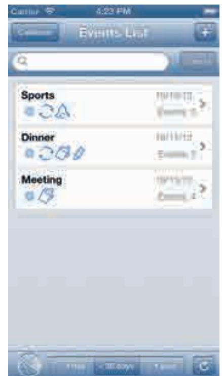
Die App Calendar Input+ mit der speziellen Event Liste.