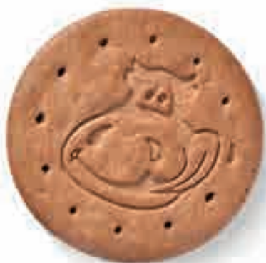
Markenzeichen: eine lustige Kuh ersetzt den alten Mexikaner.

Einer der letzten Coups der Versuchsbäcker ist die Neuauflage der Chocoly-Rollen, neben den Choco Petit Beurres und den Jura Waffeln eines der Leaderprodukte von Wernli. «Gerade bei den Chocoly, die es neu in mini geben wird, war es ein Problem, dass die Biscuits auch in der kleineren Ausführung ihren typischen Biss behalten», erklärt Ma-