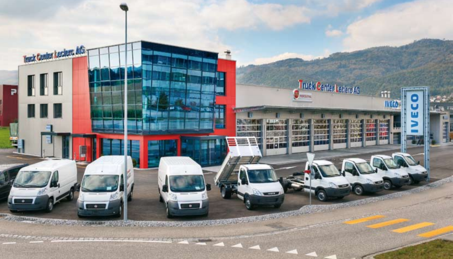
Das eindruckliche neue Gebäude der Truck Center Leclerc AG in Härkingen. Einzugstermin war im April 2011.